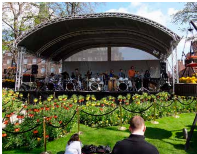
North West Percussion spillede på Den grønne scene, som de har gjort mange gange før.