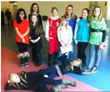
T.v. er det "Kor i Nord" og t.h. "Syng i Syd". Billedet herunder er fra fælleskoncerten.

På Youtube kan man finde klip med de glade deltagere.