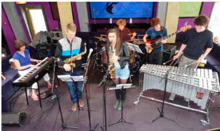
Grabbing the Groove

Ved Musikskoledage i Tivoli 4. og 5. maj var Musikskolen repræsenteret med fire grupper. Odsherred Musikskoles Big Band kørte direkte fra Forårsmusikdagen i Asnæs lørdag og videre til Tivoli, hvor de optrådte på Plænen kl.18. Søndag var turen kommet til Northwest Percussion, der indledte programmet på Den grønne Scene, Folkemusiksalen, der spillede i Lumbye-salen og Grabbing the Groove der optrådte i Woodhouse. I alt medvirkede ca. 40 elever fra Musikskolen.