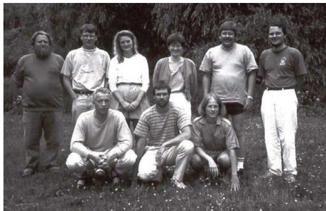
Nogle af Trundholm Kommunale Musikskoles lærere, 1992.

perioden var i høj grad præget af pionerånd, og selvom den naturligt nok har lagt sig med årene, er det min opfattelse, at der i Musikskolen stadig hersker en positiv og kreativ ånd kendetegnet ved en høj musikfaglig profilering.