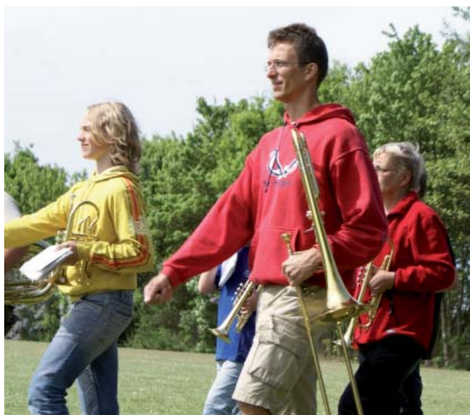
Marchtræning ved DM i Tatoo.

I løbet af dagene fik vi øjnene op for, hvor spændende et tattoo kan være, og hvor vigtigt det er at øve både musik og march. På det sociale plan hyggede vi os både alene og sammen med de andre gardere. Mange nye venskaber blev til. Alt i alt en rigtig god og lærerig tur.