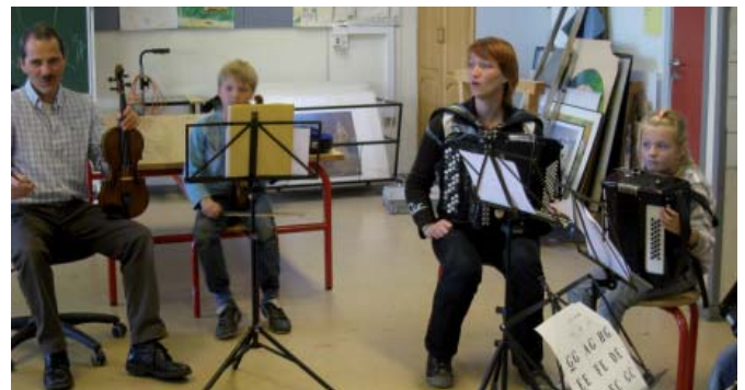
På karruselholdene prøver man tre forskellige instrumenter på et år, så man henad vejen kan finde sit yndlingsinstrument.

Alt i alt er Nordgårdsskolen det sted efter Mejeriet hvor der finder mest undervisning sted. I alt godt 100 elever fordelt på slagtøj, harmonika,violin, guitar, elbas, blokfløjte, klaver, solosang, kor, karruselhold, stryggersammenspil for de yngste violinelever og rytmisk sammenspil. Herudover har musikskolen også klasseundervisning i børnehaveklasserne.