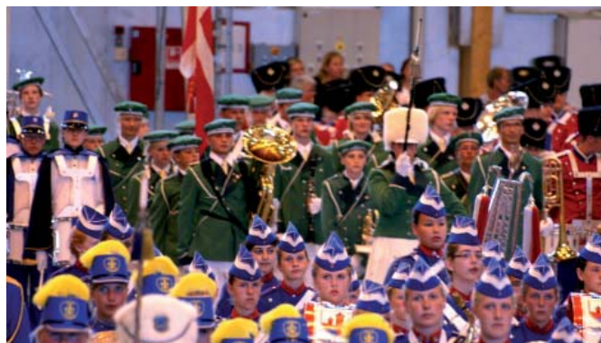
Indmarch til DM i Tatoo.

Skulle du, når du læser dette få lyst til at snuse til vores fantastiske fællesskab og musikrepertoire, så mød op en tirsdag og få en snak med os. Du er meget velkommen!