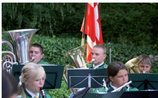
Vejret var fint og publikum fik en god oplevelse i de dejlige omgivelser, da Odsherred Garden spillede koncert ved Høve Skovpavillon d. 28. juni.