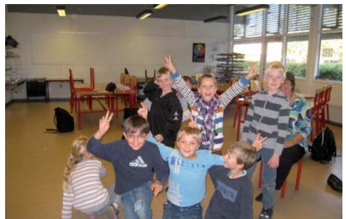
Karruselholdet undervises i Nordgårdsskolens formningslokale - her er de i gang med opvarmningen...

På Nordgårdsskolen foregår undervisningen i 5 lokaler: skolens musiklokale; to små lokaler hvor det ene også benyttes af en uddannelseskonsulent og det andet lejlighedsvis af skolesygeplejersken. Desuden benyttes skolens formningslokale og et klasselokale til undervisning.