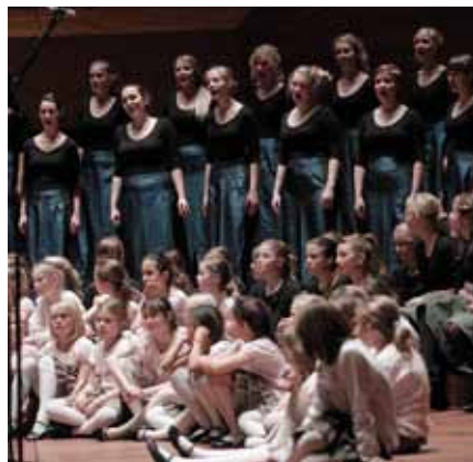
DR-PigeKorets julekoncert 19. december 2010. PigeKoret med DR-Børne- og JuniorKor foran.