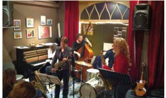
CD-release-koncert på Café Jazzcup den 17. februar 2011.

De mange forskelligartede indtryk fra disse rejser afspejler sig i kvintettens stilistiske bredde: Fra smukke ballader over groovy latin til bebopinspirerede swingnumre tilsat et krydderi af skæve taktarter og funk. Musikkens spændvidde understreges yderligere