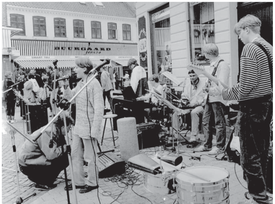
Nykøbing-Rørvig musikskole på gågaden i Nykøbing sommeren 1995.