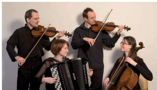
Con Tango - der betyder "med tango"

Som sædvanlig ved koncerter arrangeret af foreningen Musik i Asnæs, er der fri entré for musikskoleelever.