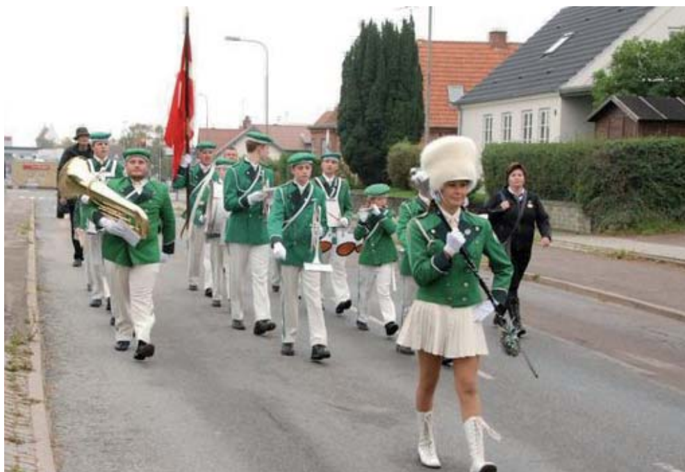
Gardens march gennem Vig på Kultursens Dag.

Selvom Garden har mange musikanter på forskellige instrumenter kunne vi godt bruge et par friske drenge eller piger til at spille trompet, klarinet, tromme, lyre eller tuba. Har du mod på at prøve kræfter med et af disse instrumenter, som kig forbi en tirsdag (gardens øvedag) og få en snak. Det kunne jo være, at det lige var dig!