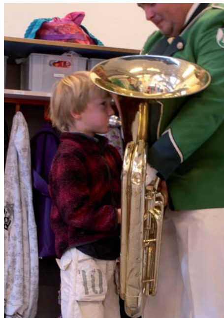
Nyt medlem af Odsherred Garden?

I tiden op til motionisterne skulle af sted for at samle kilometre til Kommunedysten spillede Garden igen. En pludselig indskydelse fra en sækkepibespiller fra The Gordon Pipes og Drumband fik tre friske gardere klar på trommerne og sammen spillede de Highland Cathedral. Rigtig hyggeligt med lidt jam på tværs af alder og genre.